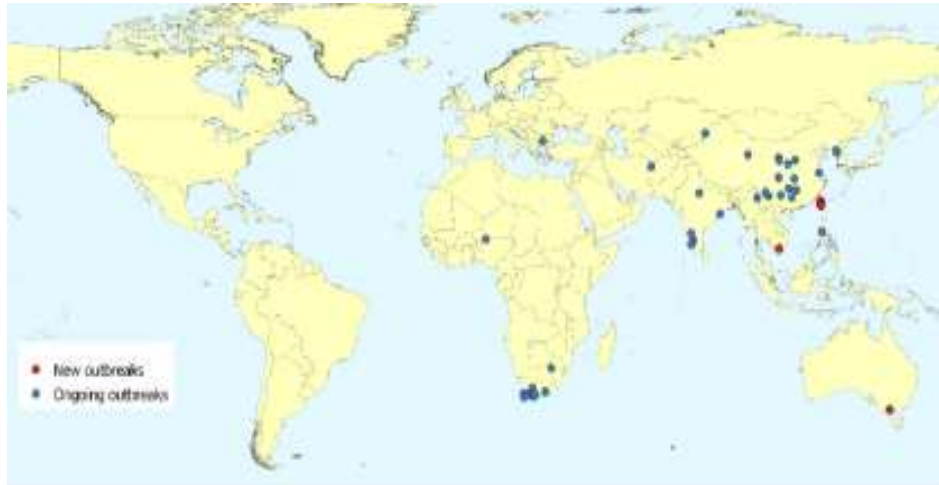
ภาพที่ 1 การระบาดของสัตว์ปีกใหม่อย่างต่อเนื่อง ระหว่างวันที่ 31 กรกฎาคม – 20 สิงหาคม 2563

ข้อมูลจากองค์การโรคระบาดสัตว์ระหว่างประเทศ ยังพบเหตุการณ์การระบาดของโรคไข้หวัดนกในสัตว์ ในหลายประเทศทั่วโลก ดังนี้